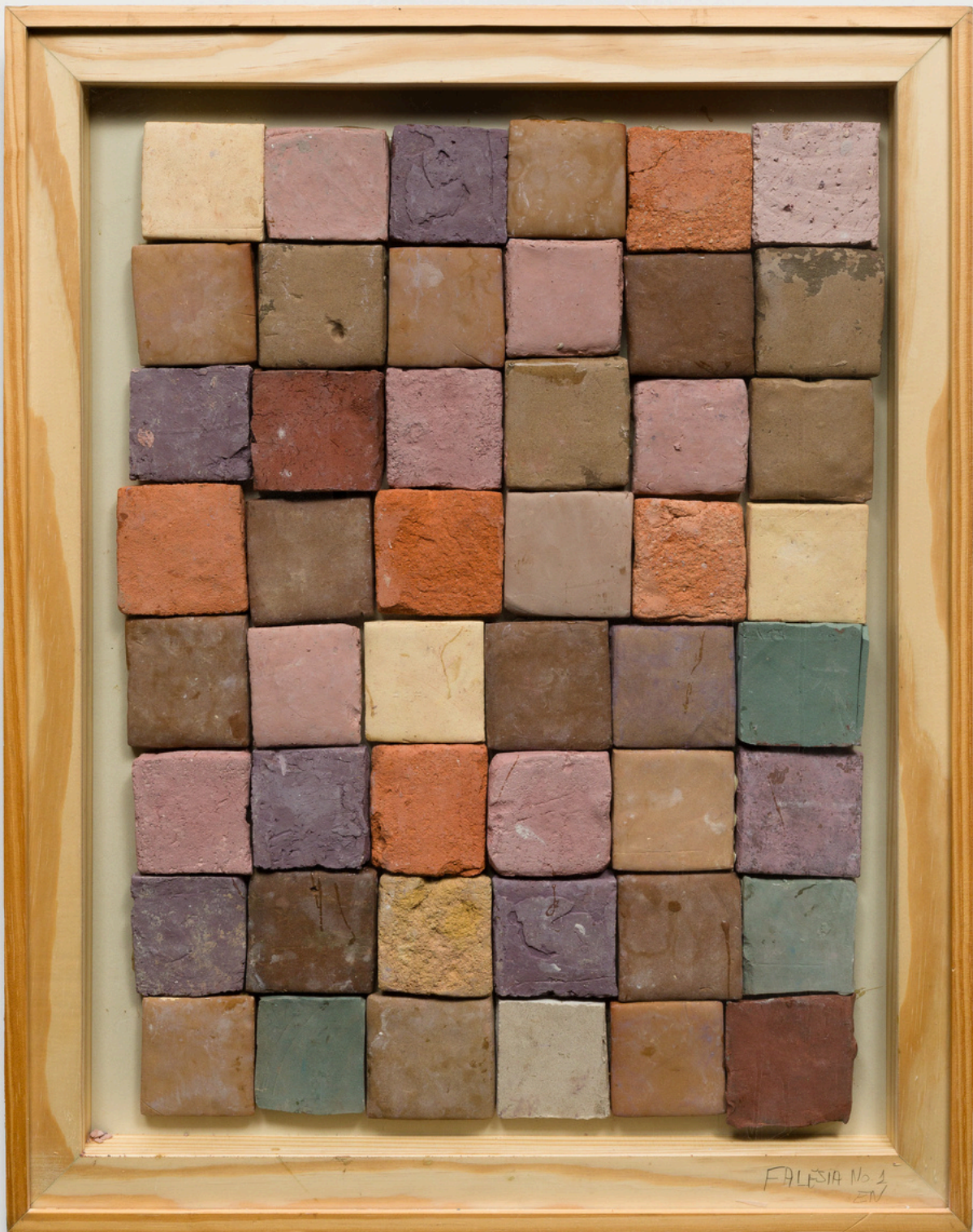
EDUARDO NAZARIAN Falésia, 2024 Série Falésia Argila Nativa(Wild Clay) 81cmx 62cm Edição única