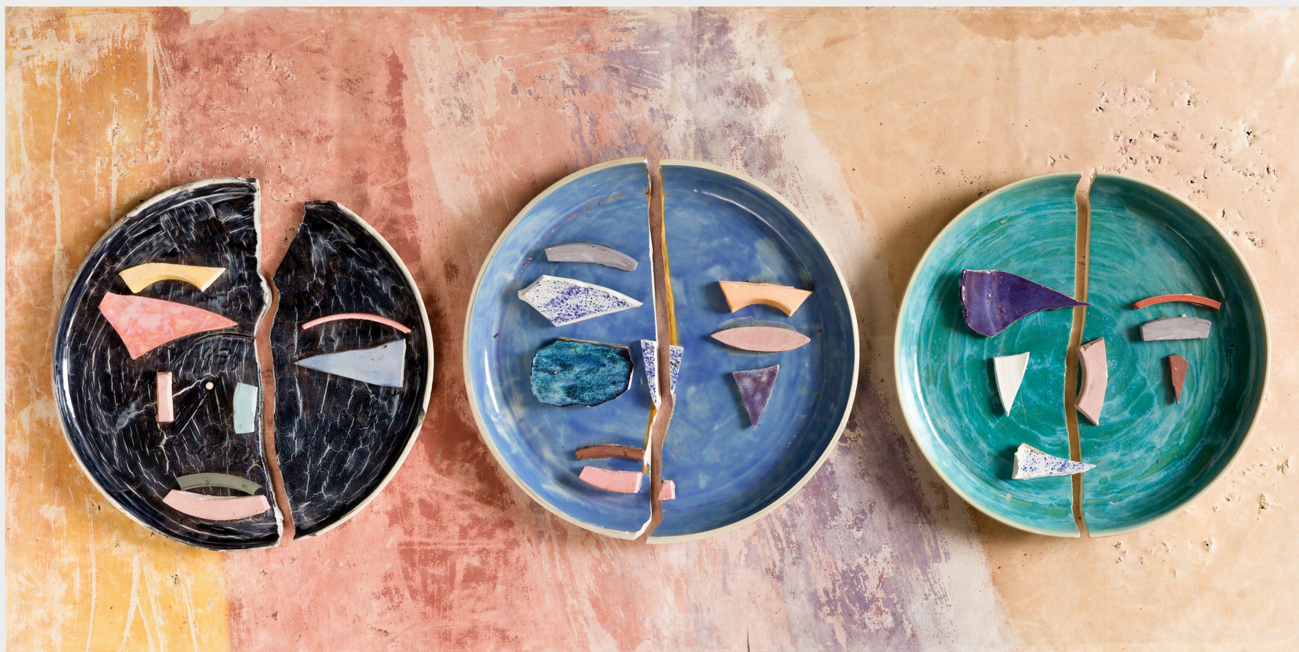
EDUARDO NAZARIAN 3 Auto Retratos , 2024 Série Selfs Porcelana/Porcelain 48cm diametro Edição única